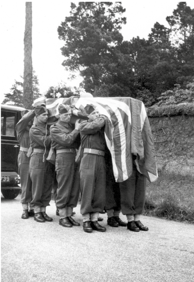
Huit soldats canadiens portant sur leurs épaules un cercueil couvert d'un drapeau

Collection d'archives George-Metcalf Musée canadien de la guerre MCG 19900228-105