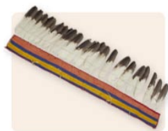
Ornement de lance